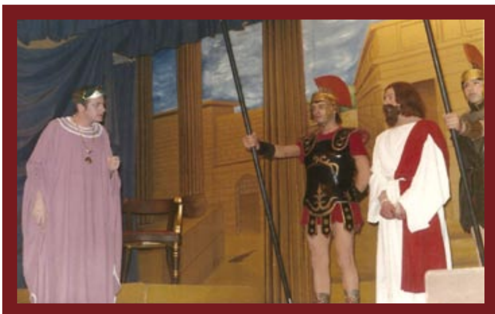
1978 La Passion

En 1981, un nouveau comité gestionnaire et propriétaire des bâtiments est créé. Cette asbl s'appellera « Centre Culturel Sibretois » et aura pour objectif principal