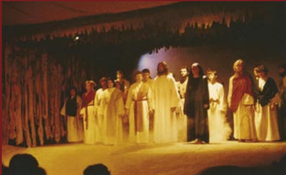
1985 La Passion