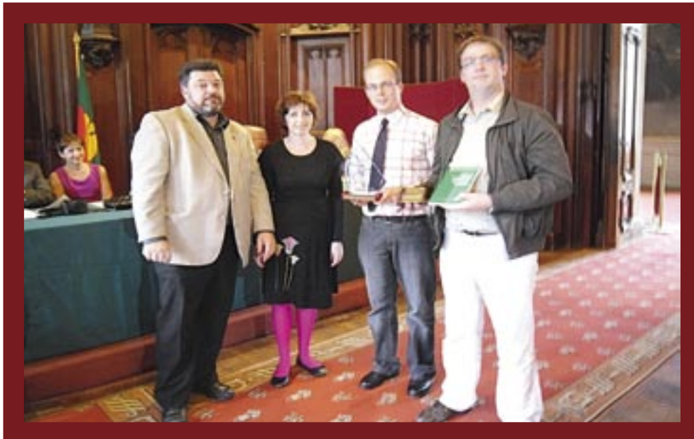
2010 Remise du prix PHEBUS pour La Passion à l'hôtel de ville de Bruxelles