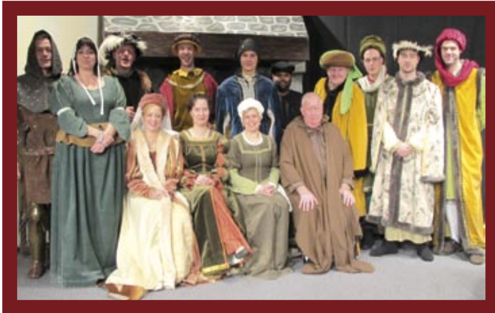
2011 La troupe de Mordiable, encore raté !