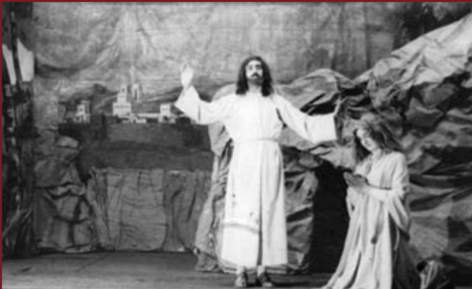
1951 La Passion